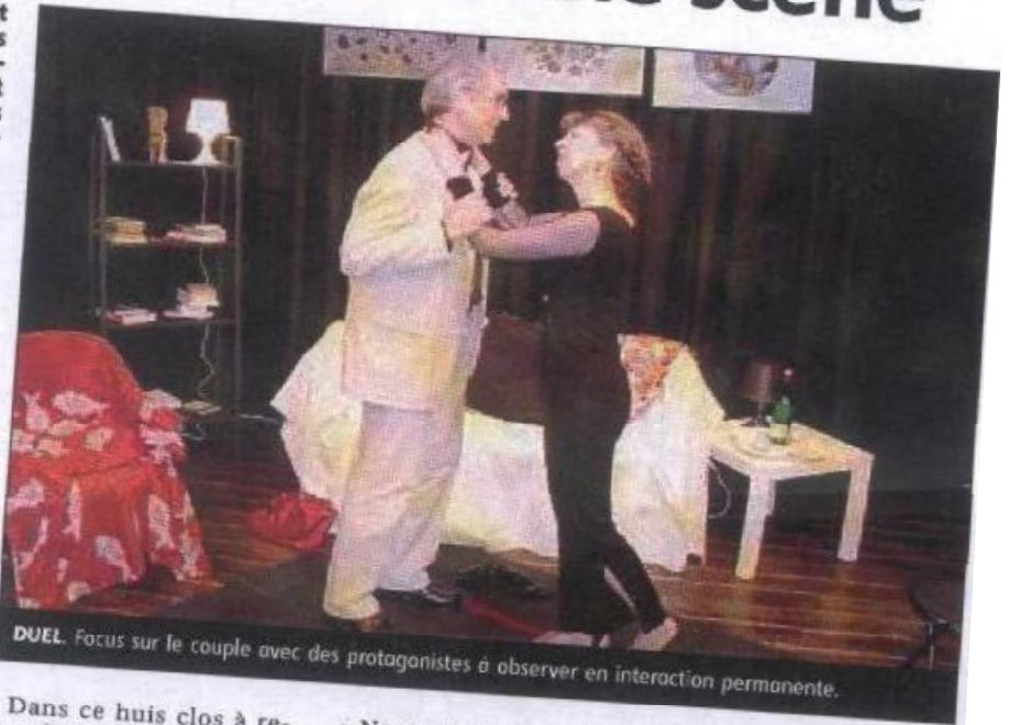
DUEL. Focus sur le couple avec des protagonistes à observer en interaction permanente.

« Petits crimes conjugaux », une pièce qui comporte bon nombre d'observations très pertinentes sur les relations humaines et une tentative de réponse à la question : la vie conjugale fait-elle de nous des assassins ? ■