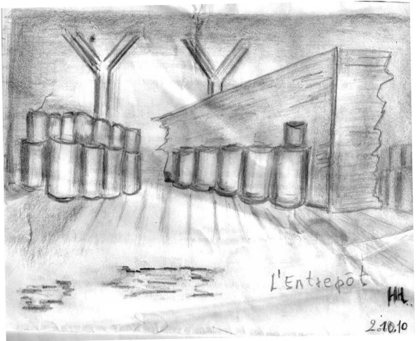
Esquisse pour le décor de l'Entrepôt